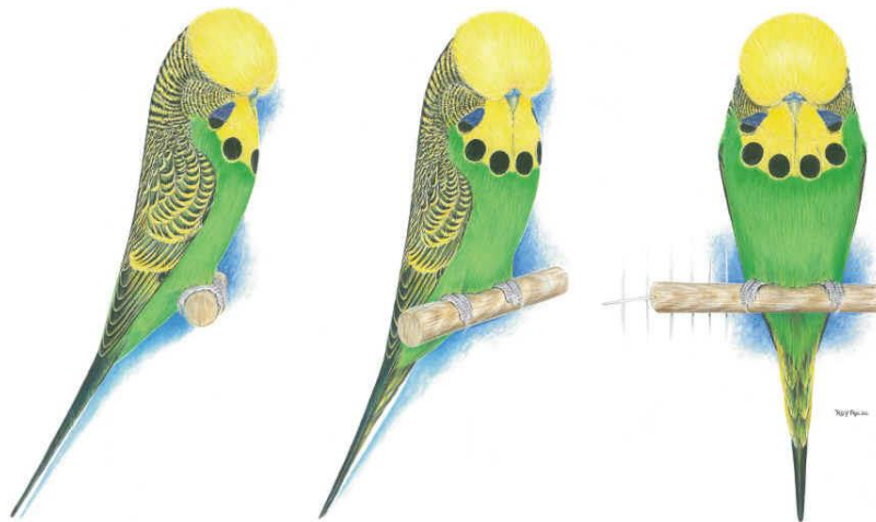
The Official WBO Pictorial Ideal

Het ligt voor de hand om het geldende ideaalbeeld van de WBO als uitgangspunt te nemen. Dit ideaalbeeld ziet er als volgt uit.