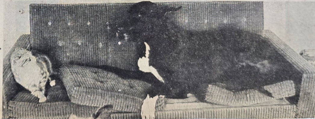
● Boudewijn en Dennis zijn niet zo erg op elkaar gesteld.

in totaal 5 muizen. Die gekke onderverdeling is nodig om een stormachtige gezinsuitbreiding te voorkomen. In de „mannenbak” zit een mannetjesmuisje en in de „vrouwenbak” dribbelen 4 vrouwtjesmuisjes door elkaar. De muizen worden gevoerd met een speciaal muizenvoer en af en toe een blaadje sla. De vissen hebben ook een mannen- en een vrouwenbak. Door een lamp wordt de tropische temperatuur gehandhaafd. De exotische visjes leven over het algemeen in een goede verstandhouding met de andere bewoners. De katten liggen soms op het warme dekset te slapen. Mevr. Tjaden zegt: „We hebben alleen een keer een ongeluk gehad, toen Dennis met zijn staart door de bak ging. Toen vlogen de vissen door de kamer, maar er waren er niet veel dood.”